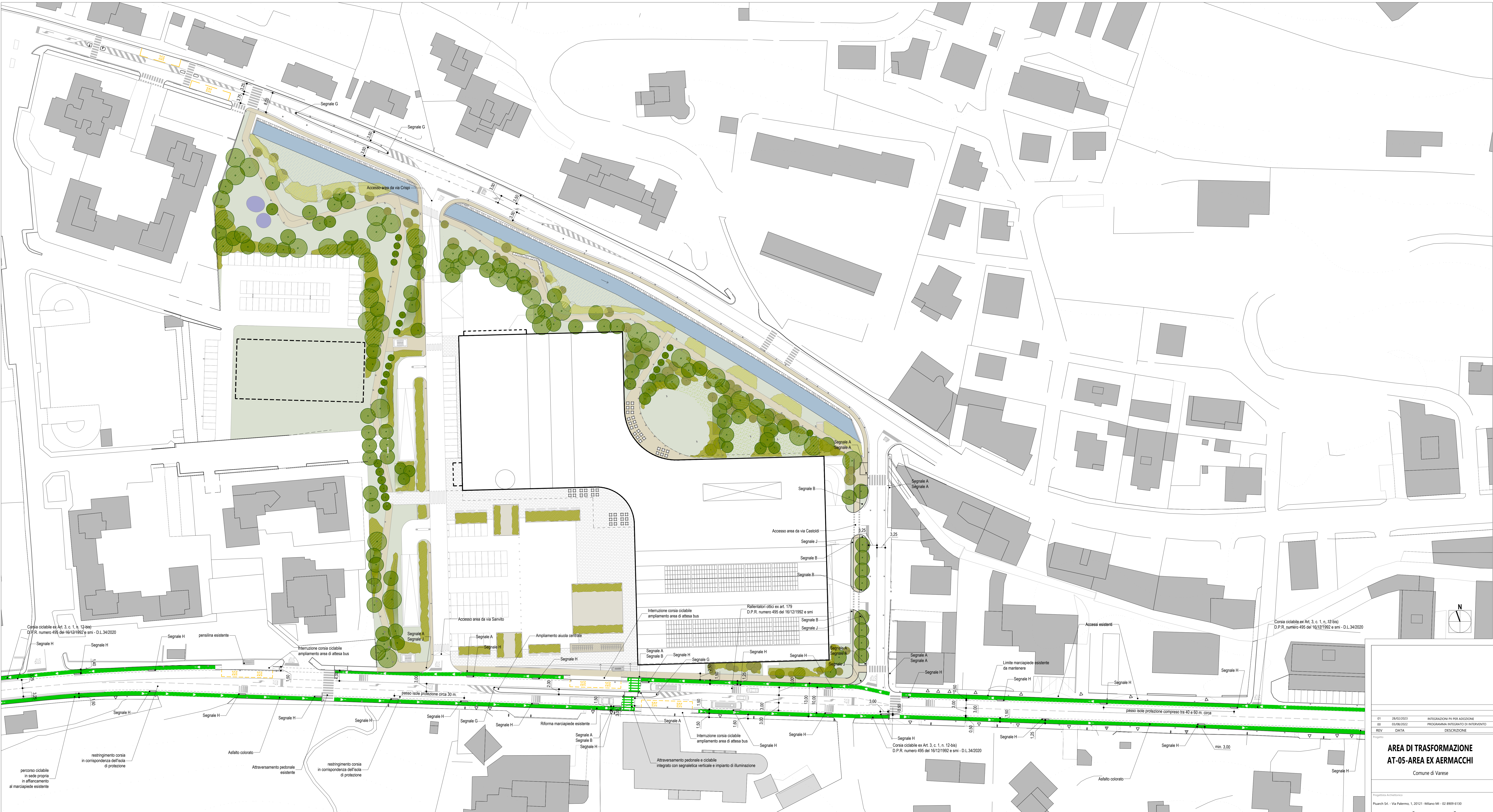
TRATTO C - Via Sanvitto (da via Proserpio a negozio Maxizoo), via Castoldi e via Crispi